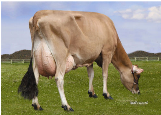
LUCKY HILL JOKER WABORITA FOURTH DAM